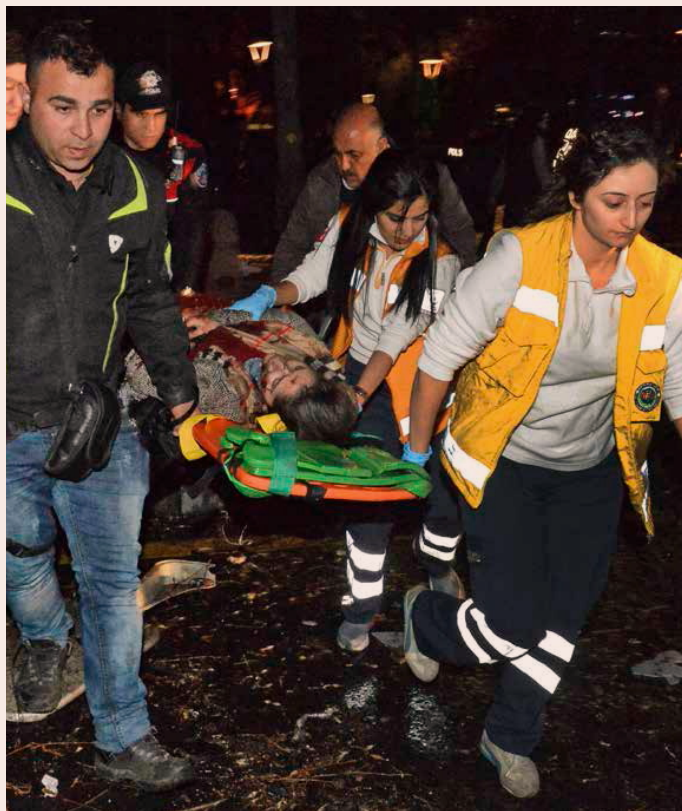
ÖKAT HOT. Attentatet i Turkiets huvudstad Ankara, där 37 människor miste livet, försvårar de pågående förhandlingarna om fred i Syrien.

MIKAEL BJÖRK mikael.bjork@di.se 08-573 652 25